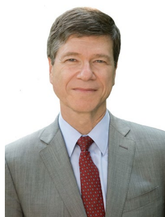
Jeffrey D. Sachs Directeur Réseau des Solutions pour le Développement Durable (SDSN)